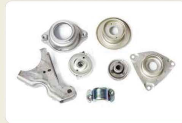
프레스 제품류 / Press products / プレス製品