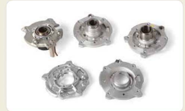
다이캐스팅 가공 부품 (가전제품) Die casting machining components (home appliances) ダイカスト切削加工部品 (家電製品)