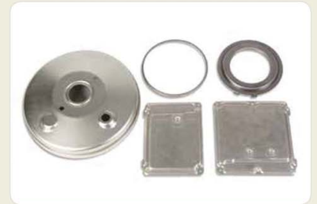
프레스 제품류 / Press products / プレス製品