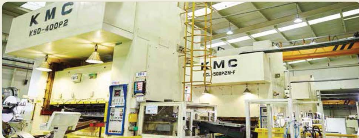
500톤, 400톤 프레스( Progressive / Transfer ) / 500ton, 400ton press / 500トン/400トン프레스