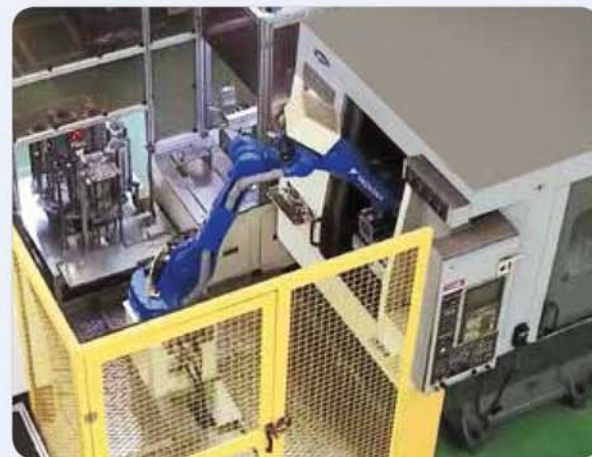
가공 자동화 라인2 / Auto machining line 2 / 自動化切削加工ライン2