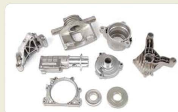
다이캐스팅 가공 부품 (자동차) Die casting machining components (automobile) ダイカスト切削加工部品 (自動車)