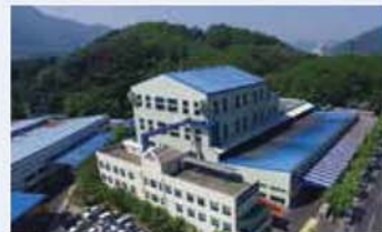
평화씨엠비(주) / Pyung Hwa CMB Co., Ltd. / 平和CMB(株)