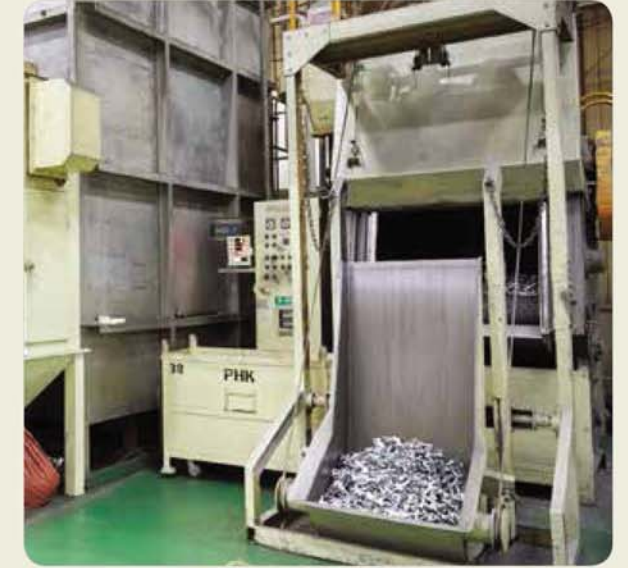
쇼트기 / Shot blast machine / ショットブラスト機