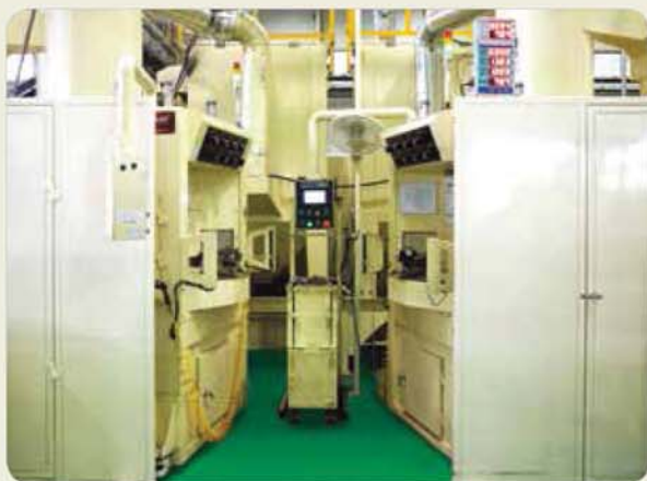
인덱스 타입 샌딩기 Index type sanding blast machine インデックスタイプ サンディング プラスト機