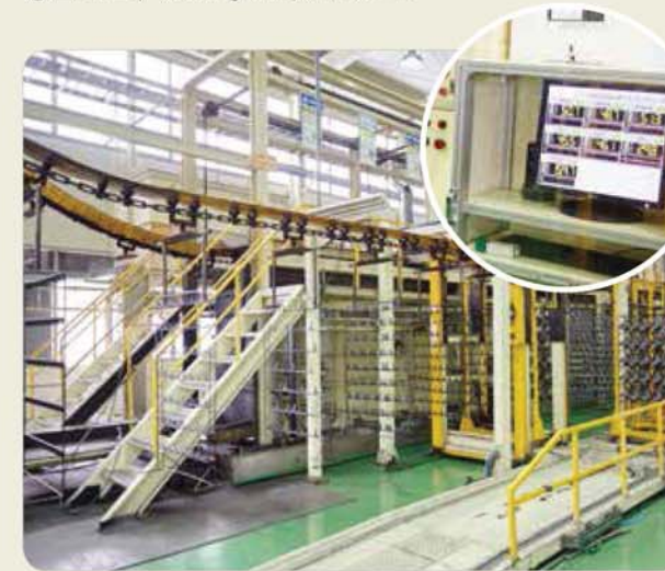
전착도장 / Electro painting / 電着塗装