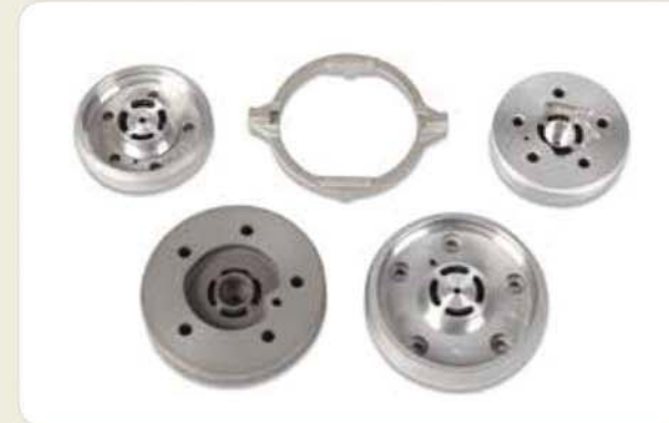
다이캐스팅 가공 부품 (가전제품) Die casting machining components (home appliances) ダイカスト切削加工部品 (家電製品)