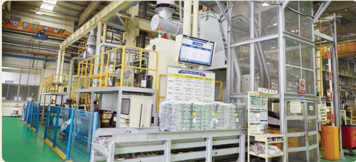
중앙집중식 용해로 / Centralized melting furnace / 中央集中式溶解炉

Aluminum Die casting-Related Equipments for the Automotive and General Industries 自動車及び一般産業用 アルミニウム ダイカスト関連設備