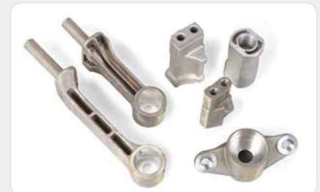
다이캐스팅 가공 부품 (자동차) Die casting machining components (automobile) ダイカスト切削加工部品 (自動車)