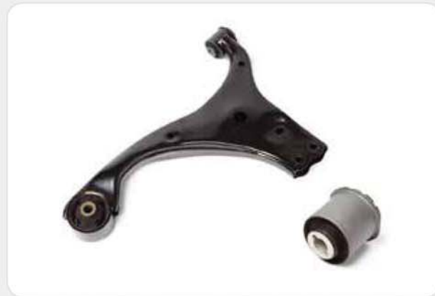
프레스 조립품 / Press assembly / プレスアッセンブリ