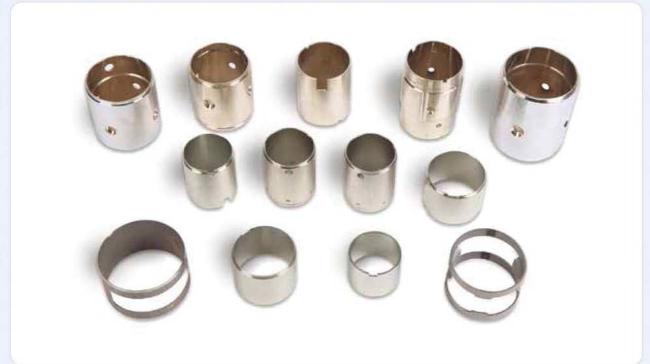
모터 프레임 & 방진 부품 / Motor frame & anti vibration components / 모터 프레임&防振 부품