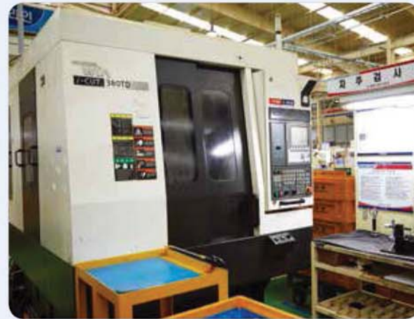
MCT 가공 라인 / MCT line / MCT 라인