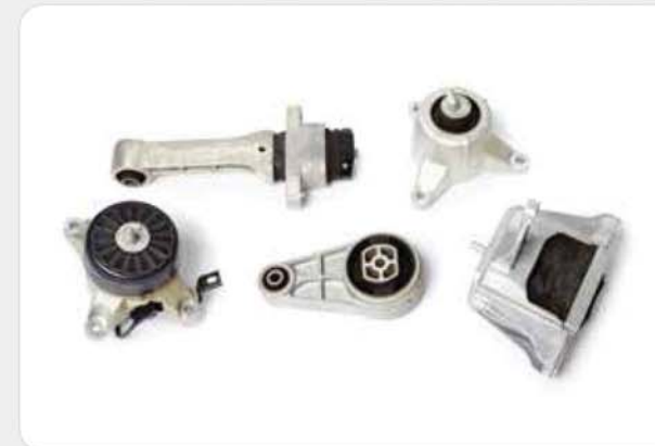
다이캐스팅 조립품 Die casting assembly / ダイカストアッセンブリ