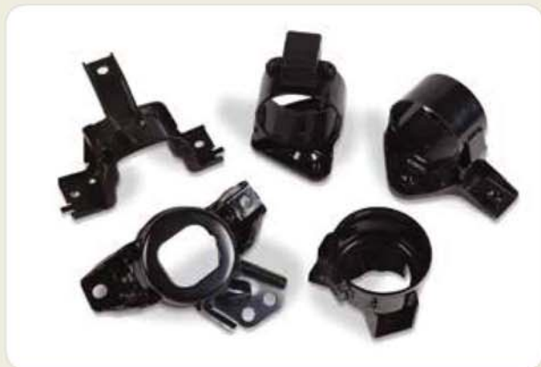
프레스 제품류 (용접+전착도장) Press products (welding + electro painting) プレス製品 (溶接 + 電着塗装)