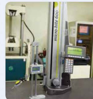
2차원 측정기 Two coordinate measuring machine 2次元測定器