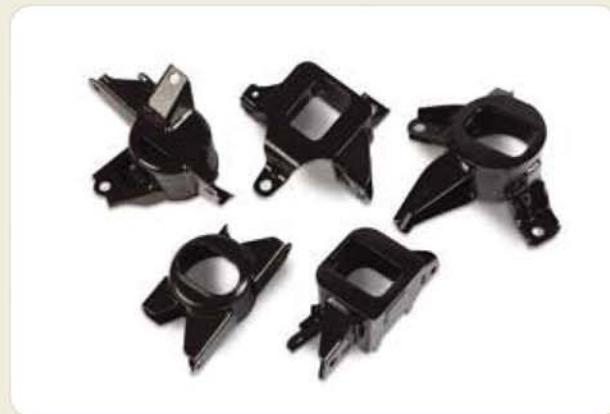
프레스 제품류 (용접+전착도장) Press products (welding + electro painting) プレス製品 (溶接 + 電着塗装)