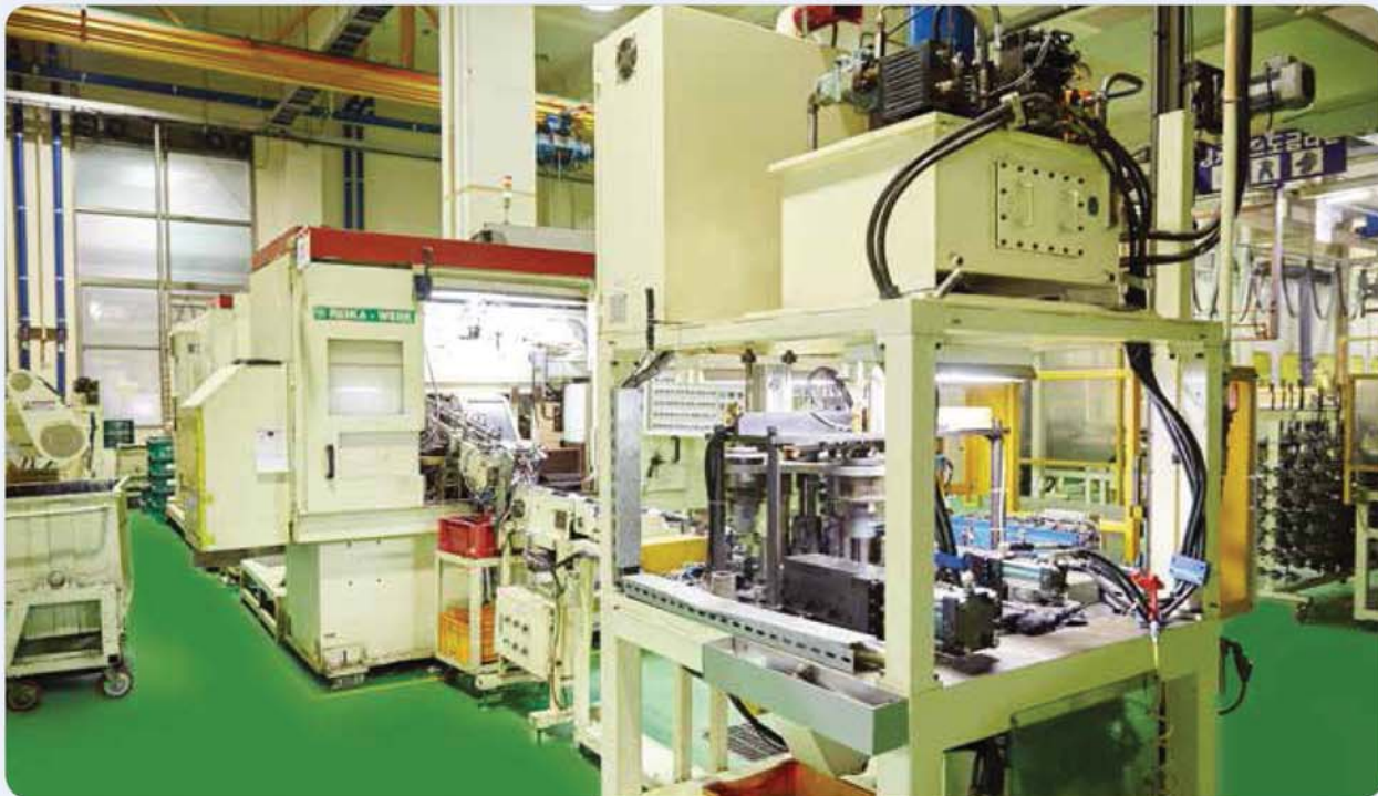
파이프 절단/면취/자동노칭기 / Pipe cutting / chamfering / auto notching machine / 파이프切斷/面取/自動ナッチング機