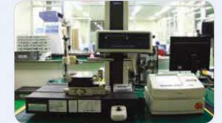
표면조도 측정기 Surface roughness measuring instrument 表面粗度測定器