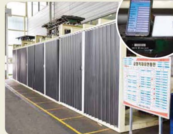
금형 보관장 - RFID 시스템 Mold storage place - RFID system 金型保管場所 - RFID 시스템