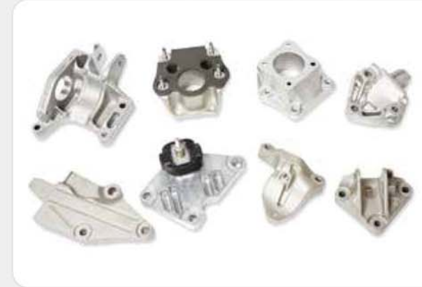
일반(고압) 다이캐스팅 제품 High pressure die casting products / 高圧ダイカスト製品