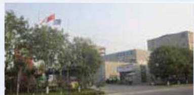
천진평화화학유한공사 Tianjin Pyung Hwa Elastech Co., Ltd. 天津平和化学工業有限公司