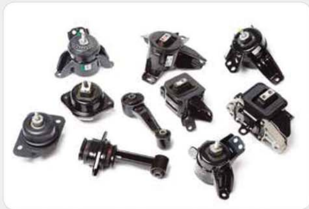
프레스 조립품 / Press assembly / プレスアッセンブリ

Precise Press Products for the Automotive and General Industries 自動車及び一般産業用 精密プレス 製品