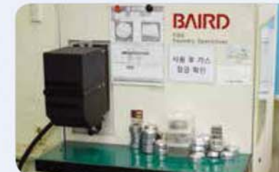
성분 분석기 Ingredient analyzer 成分分析器