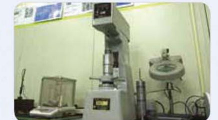
로크웰경도 측정기 Rockwell hardness measuring instrument ロクウェル 硬度測定器