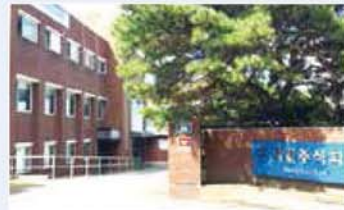
서일(주) / Seoil Co., Ltd. / 소일(株)