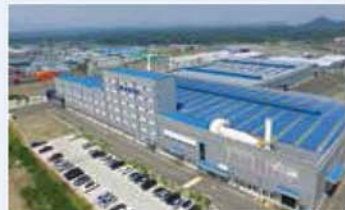
(주)피엔디티 / Pyung Hwa NOK Drive Train Co., Ltd. / (株) PNDT