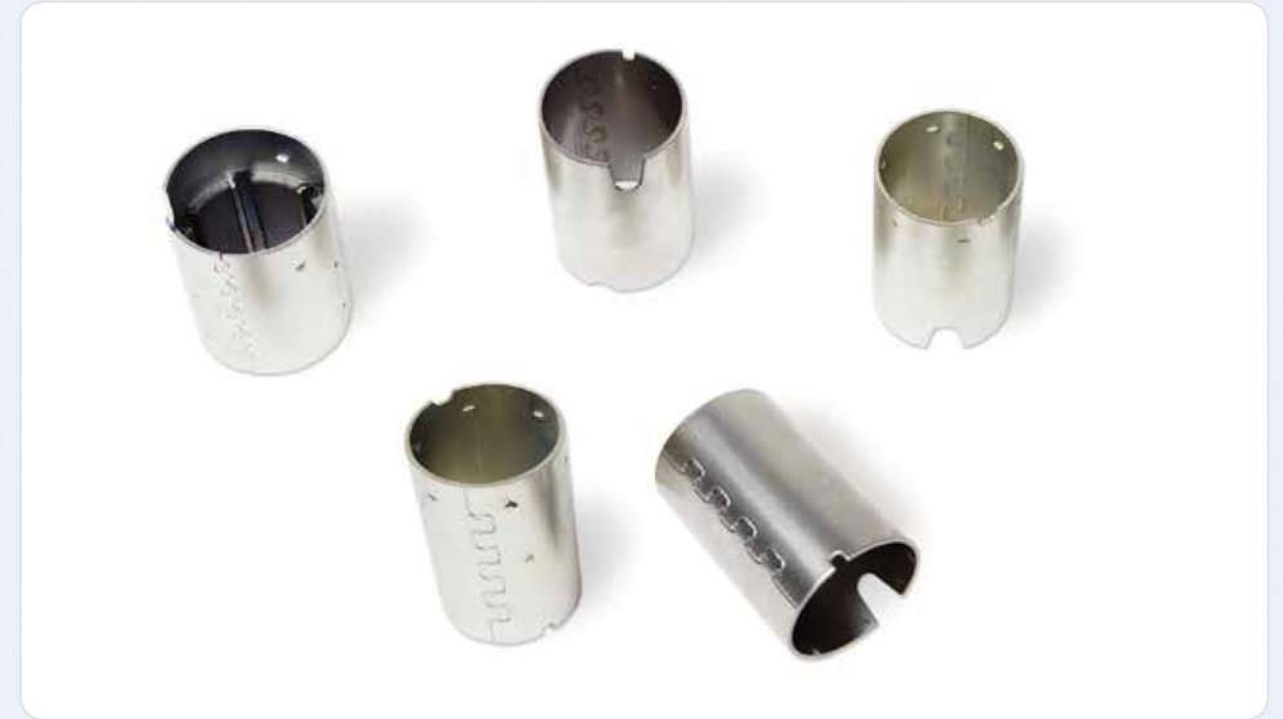
모터 프레임 부품 / Motor frame components / 모터 프레임 부품