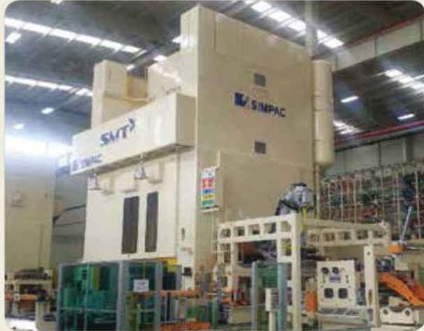
1000톤 프레스 / 1000ton press / 1000トン プレス

Precise Press-Related Equipments for the Automotive and General Industries 自動車及び一般産業用 精密プレス 関連設備