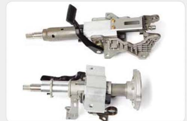
다이캐스팅 조립품 Die casting assembly / ダイカストアッセンブリ