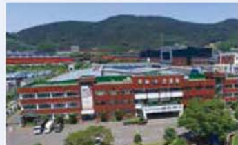
평화오일씰공업(주) / Pyung Hwa Oil Seal Industrial Co., Ltd. / 平和オイルシール工業(株)