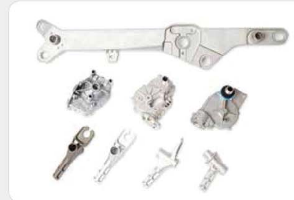
일반(고압) 다이캐스팅 제품 High pressure die casting products / 高圧ダイカスト製品