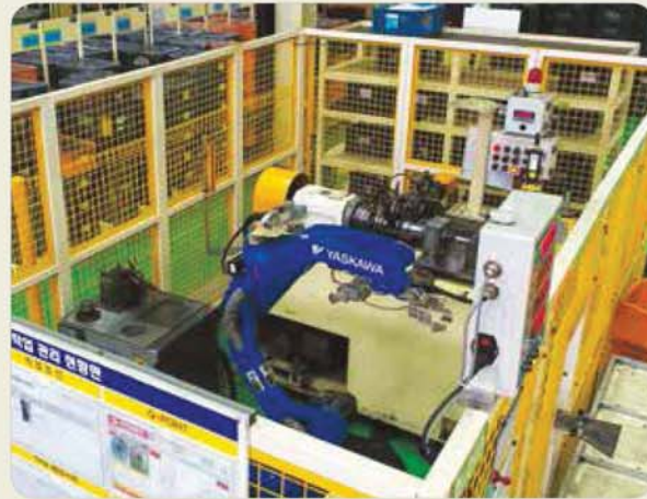
롤링 & 프로젝션 용접기 Rolling & projection welding machine ローリング&プロジェクション 溶接機