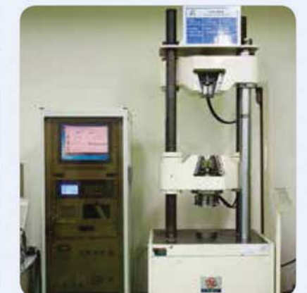
만능시험기 Universal testing machine 万能試験器