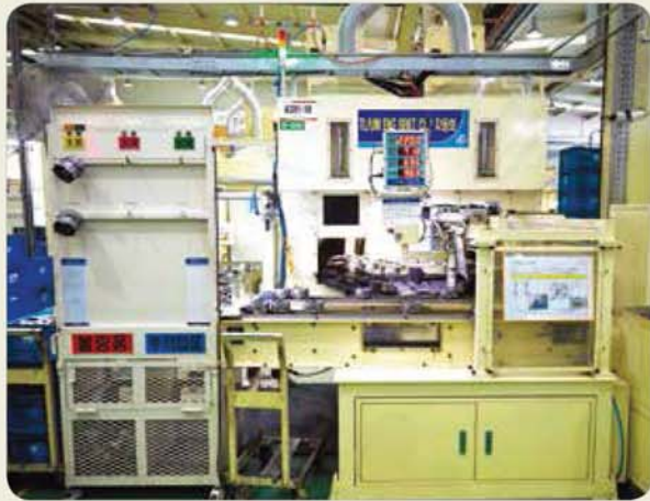
자동용접기 / Auto welding machine / 自動溶接機

Precise Press-Related Equipments for the Automotive and General Industries 自動車及び一般産業用精密プレス関連設備