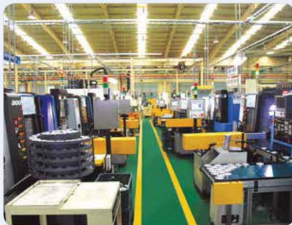
가공 자동화 라인1 / Auto machining line 1 / 自動化切削加工ライン1