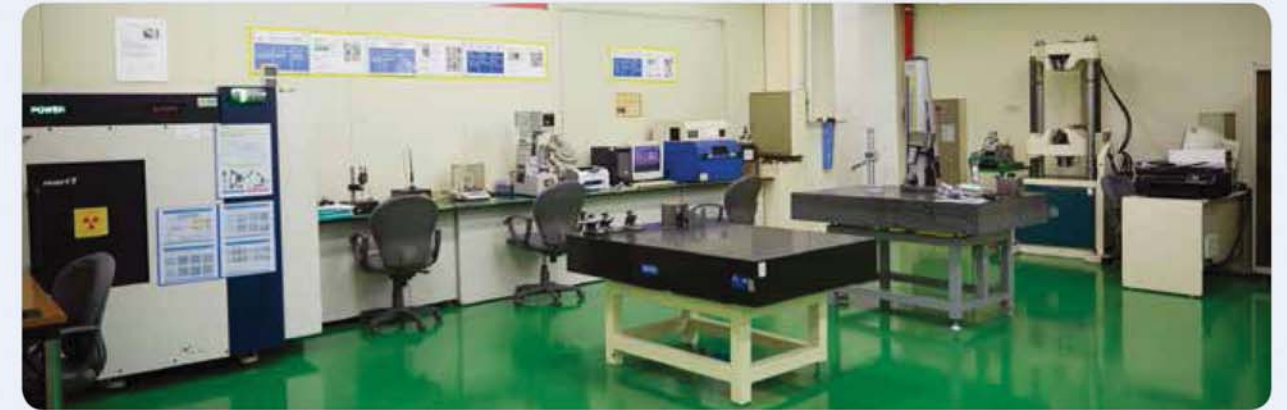
측정실 / Measurement room / 測定室

不良品出荷ZERO化、顧客からの苦情ZERO化、工程不良ZERO化を目指し、継続的な品質保証活動を行った結果、QS-9000/ ISO9001/ ISO14001/ SQ/ TS16949品質認証を取得しており、簡素化、専門化、標準化された品質管理で完璧な製品のみを生産、納品します。