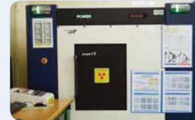
X-RAY 검사기 X-ray inspection machine X-ray 検査機器