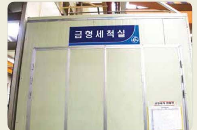
금형 세척실 / Mold cleaning room / 金型洗浄室