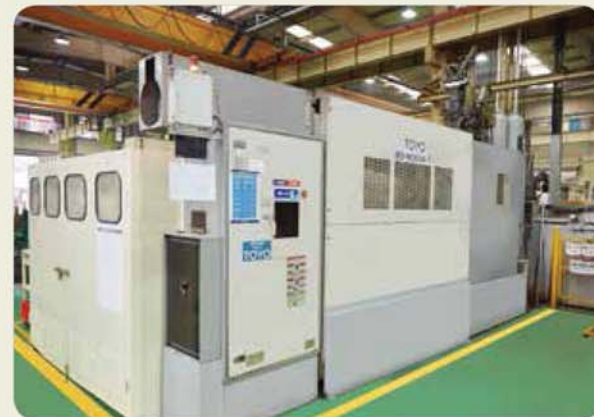
900톤 다이캐스팅 머신 / 900 ton die casting machine 900トンダイカストマシン