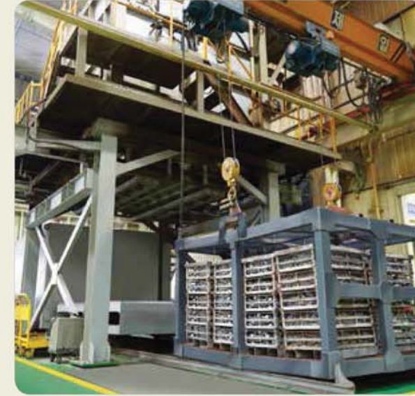
T6 열처리로 / T6 heat treating furnace / T6 熱処理炉