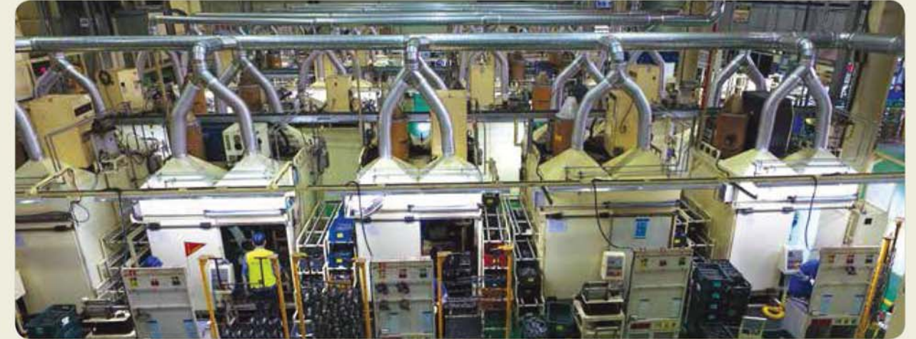
용접 라인 / Welding line / 溶接 라인