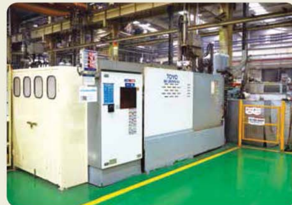
350톤 다이캐스팅 머신 / 350 ton die casting machine 350トンダイカストマシン