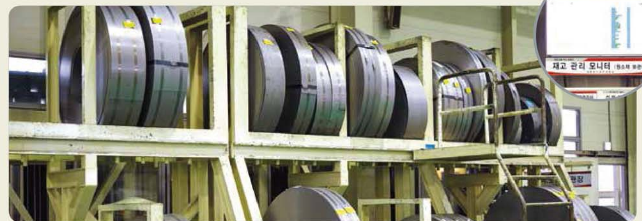
원소재 보관장 / Raw materials storage place / 原素材保管場所