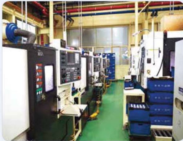
CNC 가공 라인 / CNC line / CNC 라인

Machining-Related Equipments and Products for the Automotive and General Industries 自動車及び一般産業用切削加工関連設備及び製品