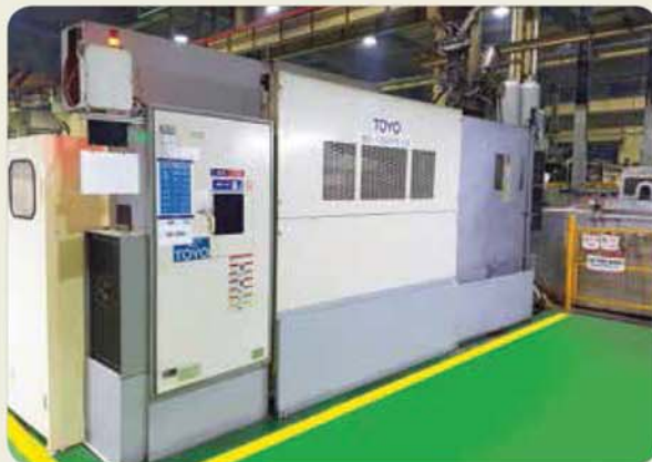
1250톤 다이캐스팅 머신 / 1250 ton die casting machine 1250トンダイカストマシン