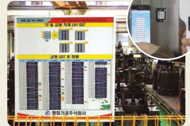
금형보관장-RFID 시스템 / Mold storage place- RFID system 金型保管場所 - RFIDシステム