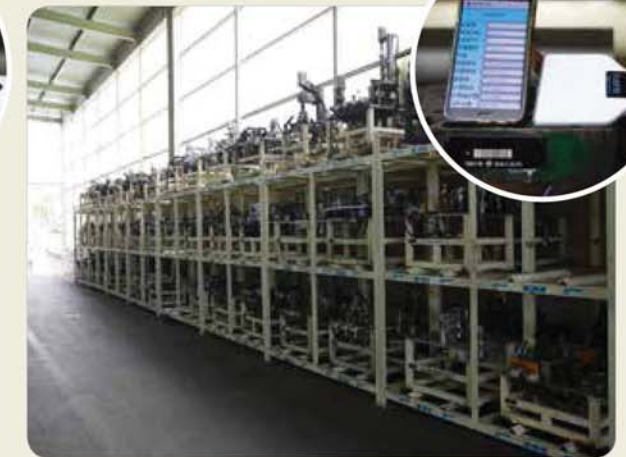
지그보관장 - RFID 시스템 Jig storage place - RFID system ジグ保管場所 - RFID 시스템