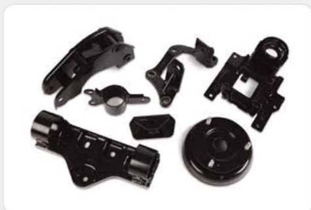
프레스 제품류 (용접+전착도장) Press products (welding + electro painting) プレス製品 (溶接 + 電着塗装)