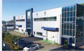
평화기공(주) / Pyung Hwa Ki Gong Co., Ltd. / 平和機工(株)