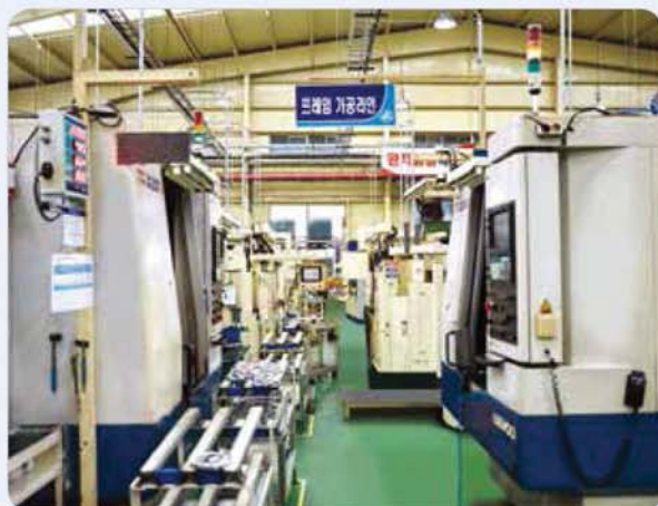
전용 가공 라인 1 / Exclusive machining line 1 / 専用切削加工ライン1