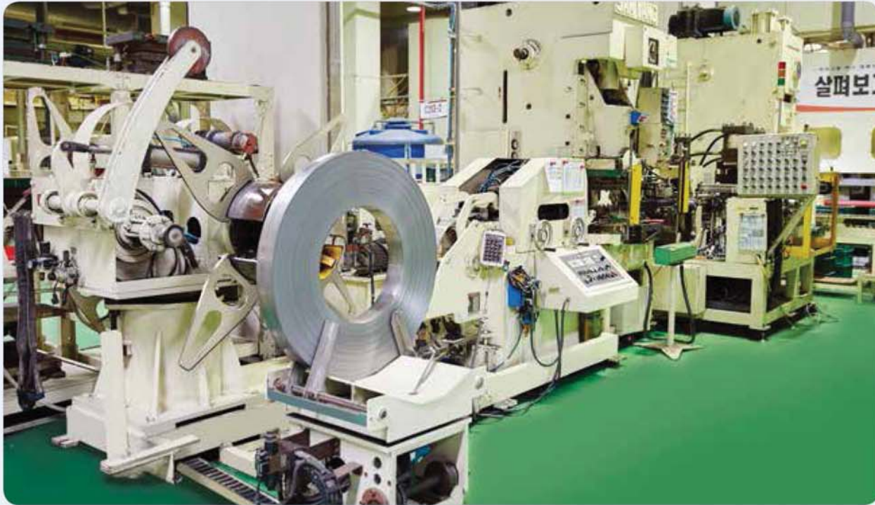
롤 & 싸이징기 / Roll & sizing machine / 롤& 사이징기

Pipe-Related Equipments and Products for the Automotive and General Industries 自動車及び一般産業用パイプ 関連設備及び製品