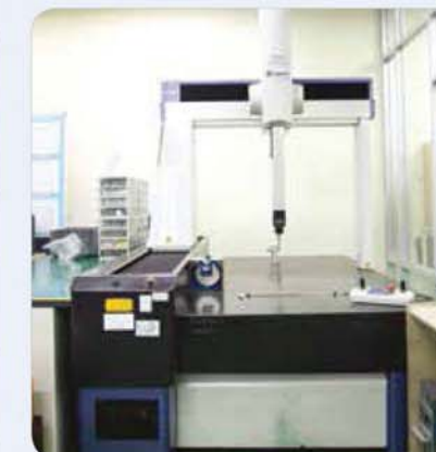
3차원 측정기 Three coordinate measuring machine 3次元測定器