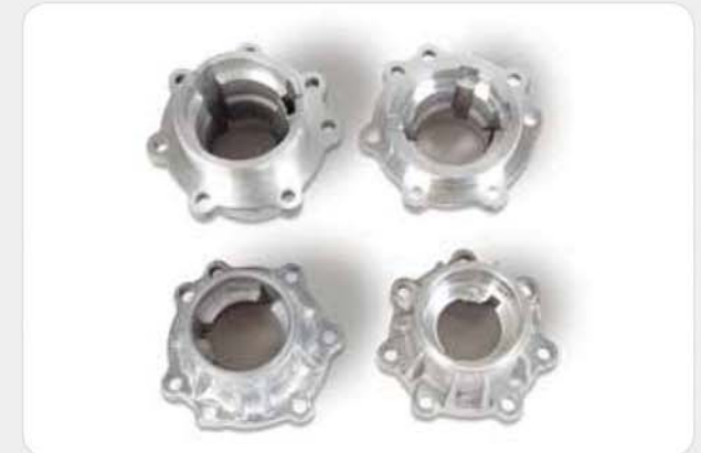
일반(고압) 다이캐스팅 제품 High pressure die casting products / 高圧ダイカスト製品