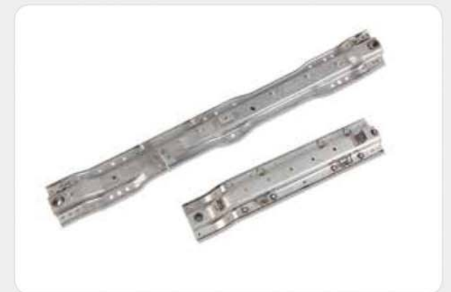
프레스 제품류 / Press products / プレス製品