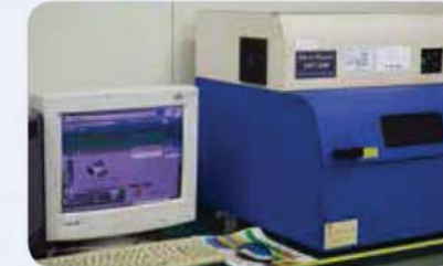
X-RAY 도막두께 측정기 X-ray coating thickness measuring instrument X-ray 塗膜厚さ測定器