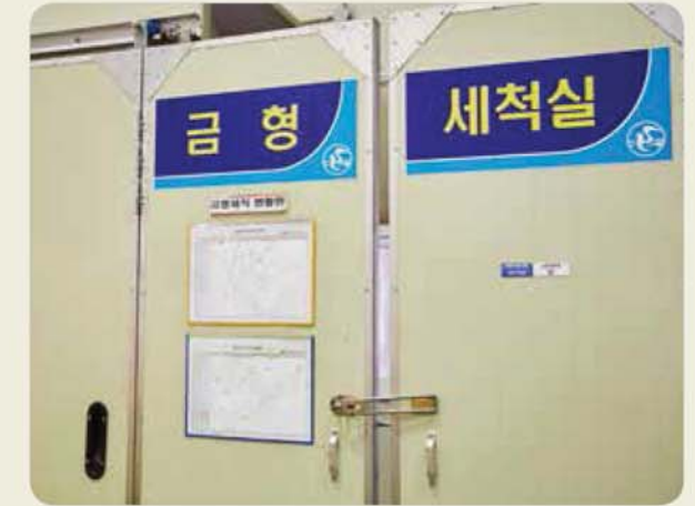
금형 세척실 / Mold cleaning room / 金型洗浄室