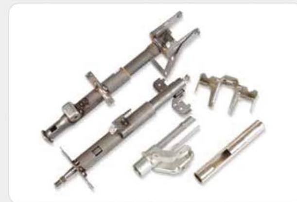
프레스 제품류 / Press products / プレス製品