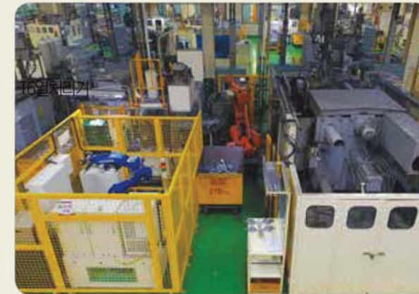
자동화 라인 / Automation line / 自動化ライン