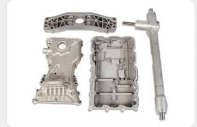
일반(고압) 다이캐스팅 제품 High pressure die casting products / 高圧ダイカスト製品