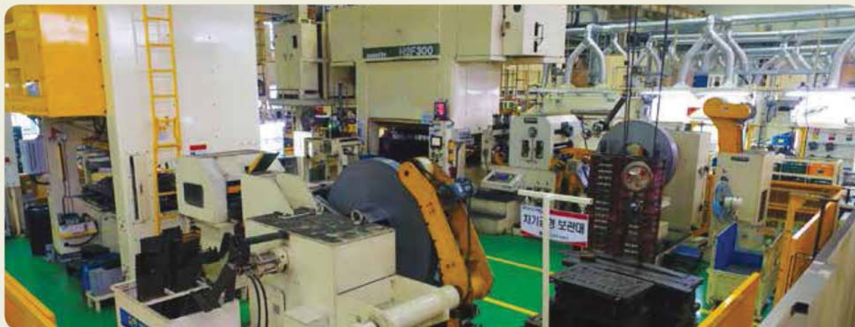
300톤 프레스 / 300ton press / 300トン프레스