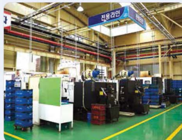
전용 가공 라인 2 / Exclusive machining line 2 / 専用切削加工ライン2