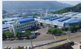
(주)평화엔지 / Pyung Hwa ENG Co., Ltd. / (株) 平和ENG