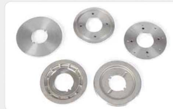
다이캐스팅 가공 부품 (전기자동차) Die casting machining components (electric automobile) ダイカスト切削加工部品 (電気自動車)