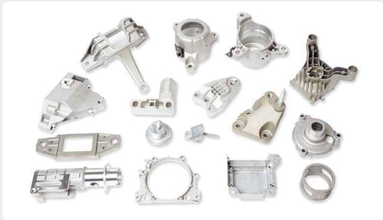
일반(고압) 다이캐스팅 제품 / High pressure die casting products / 高圧ダイカスト製品 진공 다이캐스팅 제품 / Vacuum die casting products / 真空ダイカスト製品