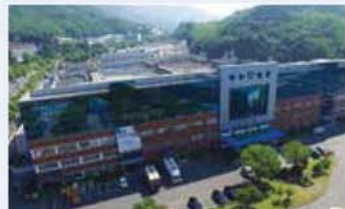
평화산업(주) / Pyung Hwa Industrial Co., Ltd. / 平和産業(株)