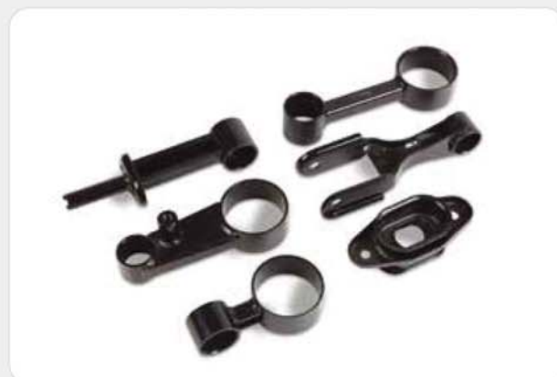
프레스 제품류 (용접+전착도장) Press products (welding + electro painting) プレス製品 (溶接 + 電着塗装)