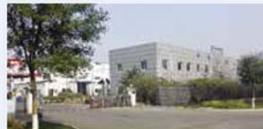
천진평화기공기차부건유한공사 Tianjin Pyung Hwa Ki Gong Co., Ltd. 天津平和機工 有限公司