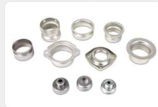
프레스 제품류 / Press products / プレス製品