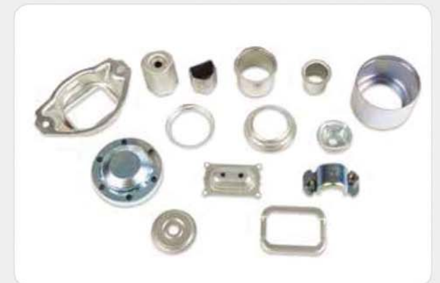
프레스 제품류 / Press products / プレス製品