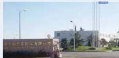
천진평화기차배건유한공사 Tianjin Pyung Hwa Auto Parts Co., Ltd. 天津平和産業有限公司