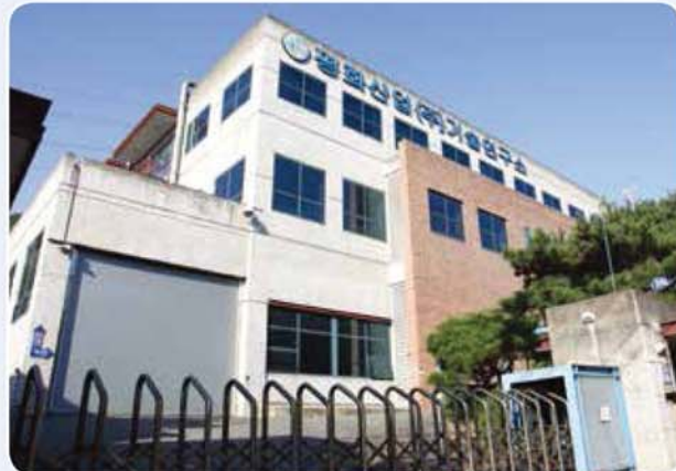
평화그룹 기술 연구소 (평화산업) Pyung Hwa group R & D center (Pyung Hwa Industrial Co., Ltd) 平和グループ技術研究所 (平和産業)

평화기공의 기술개발팀은 다년간의 경험과 기술을 바탕으로 우수한 제품개발을 위하여 끊임없는 연구와 노력을 거듭하고 있습니다. 또한, 생산실적 및 업무용 프로그램의 통합적 관리시스템으로 효율적인 생산을 뒷받침합니다.