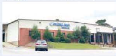
평화아메리카 Pyung Hwa America Co., Ltd. 平和アメリカ