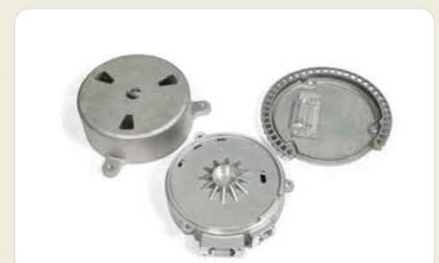
다이캐스팅 가공 부품 (수소 자동차) Die casting machining components (hydrogen automobile) ダイカスト切削加工部品 (家電製品)