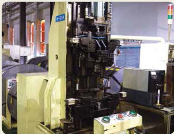
조립 전용기 / Exclusive assembly machine / 組立専用機