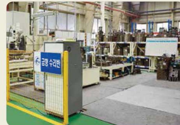
금형 수정반 / Mold maintenance room / 金型修整室