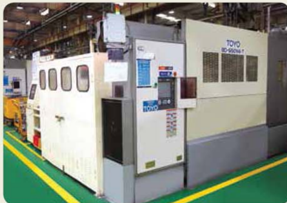
650톤 다이캐스팅 머신 / 650 ton die casting machine 650トンダイカストマシン