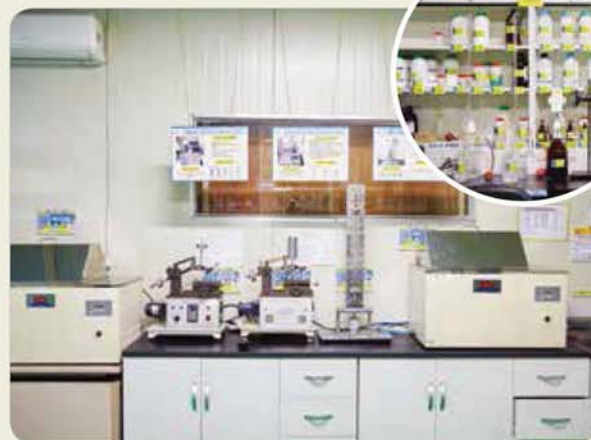
실험실 / laboratory / 試験室