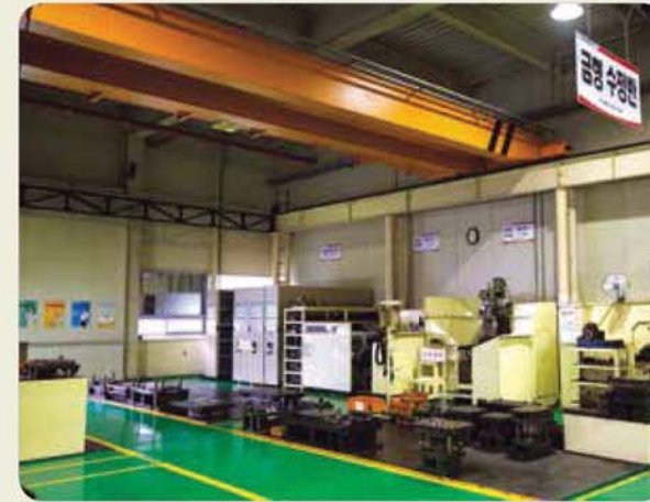
금형 수정반 / Mold maintenance room / 金型修整室