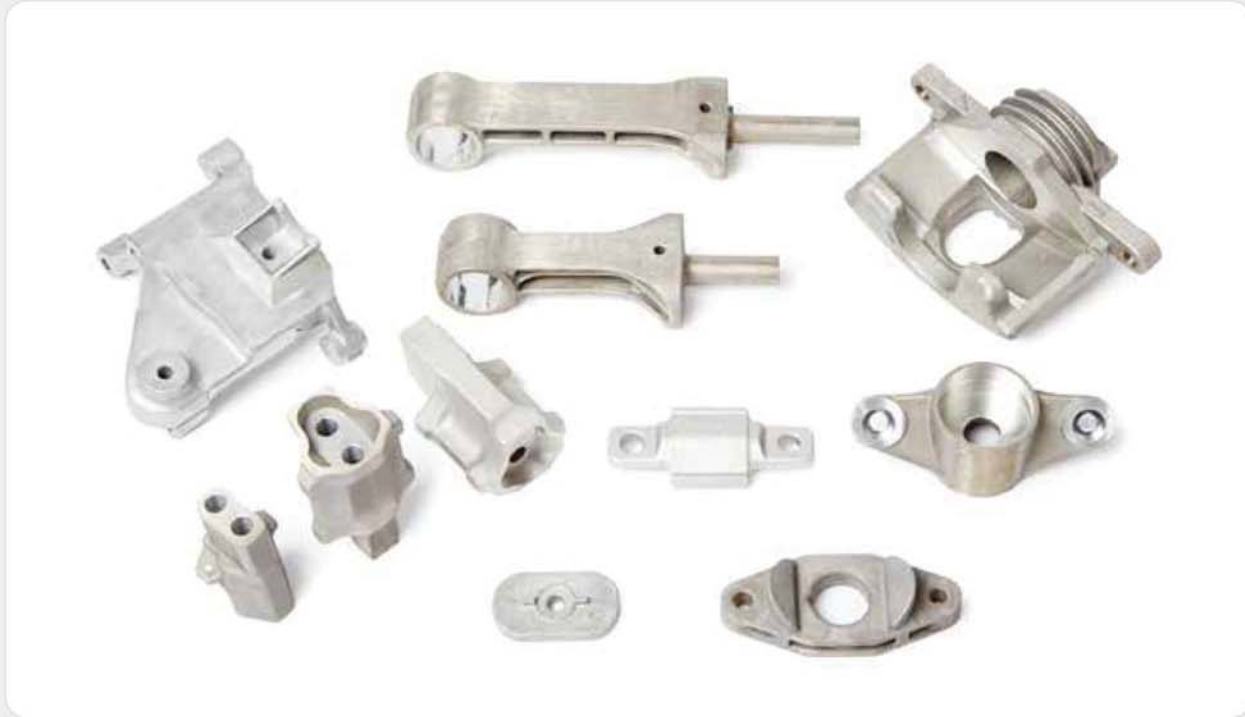
스퀴즈 다이캐스팅 제품 / Squeeze die casting products / スクイズダイカスト製品