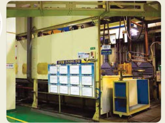
도금( 3 + ) / Electro plating (trivalent Zn) / 電氣鍍金( 3 + Zn)