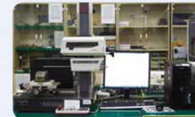
형상측정기 Contour measuring instrument 形状測定器