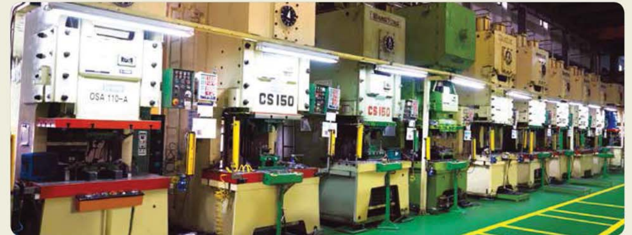
단발 프레스 - A/S 공장( 2공장 ) / Single press - A/S factory / シングルプレス - A/S工場